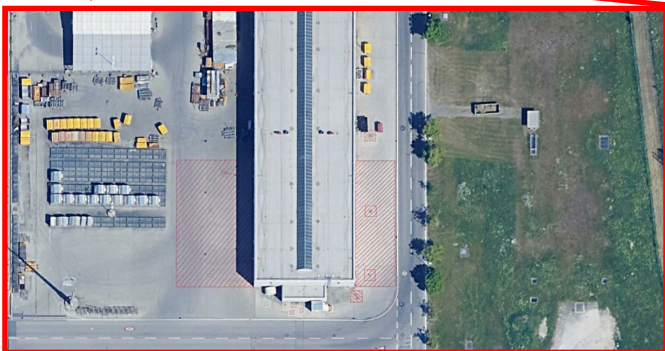
Sperrflächen bei Frachtgerätehalle [Süd]