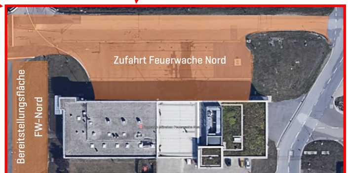
Zufahrten zu Feuerwachen [Nord & Süd]

Achten Sie darauf, dass keine Fahrzeuge, GSE oder Equipment in den oben gezeigten Feuerwehrzufahrten abgestellt werden.