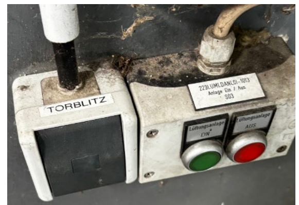
Kippschalter Torblitz (Halle H)